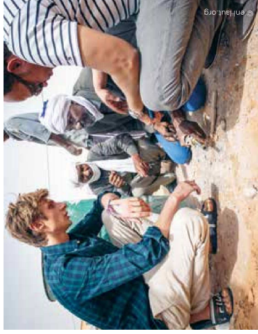
L'assistant technique (à gauche) avec l'ingénieur réseau du projet (à droite) en discussion avec les plombiers de la Société Nationale de l'Eau (SNDE).

« Ce projet a une dimension humaine et sociale importante qu'il illustre magnifiquement ce cliché. La capitale de la Mauritanie, Nouakchott, compte près de 1,2 million de personnes. Moins d'un tiers de la population y est raccordée au réseau d'eau. Proche de l'océan Atlantique, la ville se situe en plein désert du Sahara et l'eau doit y être acheminée depuis le fleuve Sénégal à 170 km. L'eau est bien présente, mais le problème provient de sa distribution. Depuis 10 ans, nos actions se concentrent sur Tahril, une des zones périurbaines les plus pauvres. Plus de 100 km de conduite ont été posés afin de donner de l'eau potable aux familles jusqu'à chez elles. En tout, plus de 4'000 ménages sont désormais branchés au réseau d'eau, comme ces deux petites filles qui ont aujourd'hui un accès direct et bon marché à l'eau potable. Grâce à cela, elles peuvent maintenant aller à l'école et n'ont plus besoin de s'occuper de la corvée de l'eau. »