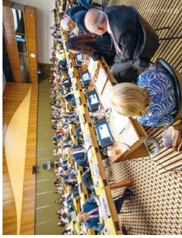
Présentation du partenariat solidaire aux Nations Unies.

Dans un souci d'amélioration continue et d'assurance qualité, une évaluation du projet par une expertise locale et internationale a été menée en 2019. Les recommandations de cette évaluation nous ont apporté des propositions concrètes sur des aspects qui seront améliorés dans les étapes à venir. »