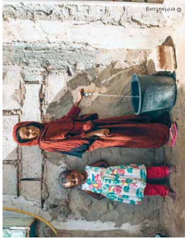
Jeunes filles de Tahiri! regardant les ouvriers qui creusent les fouilles pour la pose des conduites.

Depuis 10 ans, Lausanne et 22 autres communes ou distributeurs d'eau se sont associés à la Région de Nouakchott en Mauritanie pour améliorer l'accès à l'eau et à l'assainissement des populations défavorisées. L'équivalent d'1 centime par m 3 d'eau vendu aux citoyens suisses est dédié à ce partenariat public-public, soit l'équivalent de CHF 2 par année pour une famille de 4 personnes. Un petit geste aux grandes implications dans le quotidien des populations mauritaniennes. Vanessa Godat, responsable du partenariat avec Nouakchott pour le Service de l'eau, nous parle de ce projet au travers de photographies qu'elle a choisies.