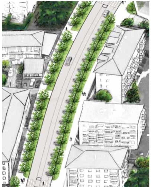
Nouvelle configuration de la voirie

L'équipe de projet vous y présentera le détail des aménagements prévus, ainsi que le déroulement des travaux.