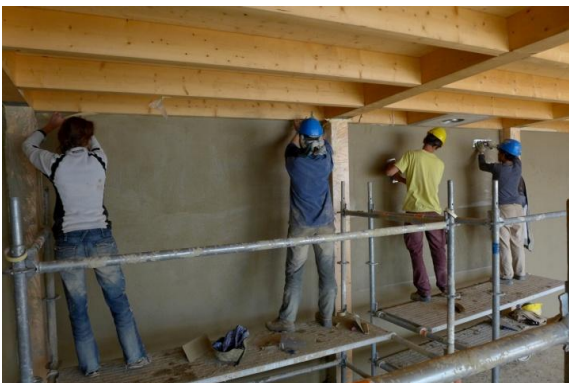
Chantier eco46, Service des parcs et domaines, Lausanne, chantier participatif avec des professionnels