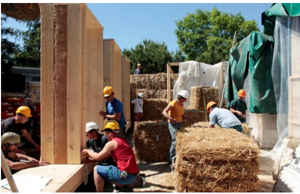
Chantier de bâtiment collectif pour les jardins familiaux de Champ Bossus à Genève, chantier participatif avec des jeunes en réinsertion