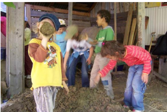
Construction du four à pain de Pierrefleur