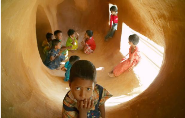
METI school by Anna Heringer and Eike Roswag (Bengladesh)