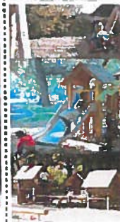
Séances de conseil aux enfants du 07/12/2012