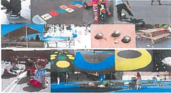
Séances de conseil aux enfants du 07/12/2012