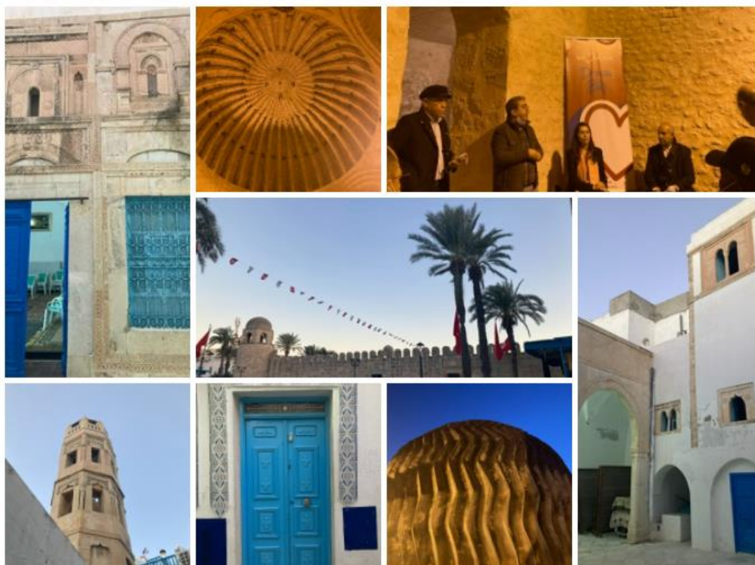
Visite de la media de Sousse, 2 décembre 2021

Aujourd'hui, la médina doit faire face à plusieurs défis qu'ils soient sociaux, culturels ou urbains. Il y a une volonté de la Municipalité de Sousse de conserver, rénover et revaloriser la médina. Plusieurs projets de mise en valeur de la médina sont en cours, comme le réaménagement des façades, des ruelles ou des monuments. L'un des projets en cours porte sur la re-végétalisation la place de la grande mosquée, afin de lui redonner les couleurs d'autrefois. L'objectif est de faire de la médina un lieu moderne, ouvert et accessible pour la population de Sousse tout en respectant l'histoire des lieux.