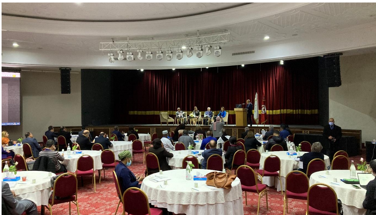
Ouverture de l'Atelier de la Commission « Villes et développement durable », Hôtel Sousse Palace 2 décembre 2021

Ainsi, depuis quelques années, la Ville de Sousse s'engage pour une politique de développement durable basé sur le principe d'équité.