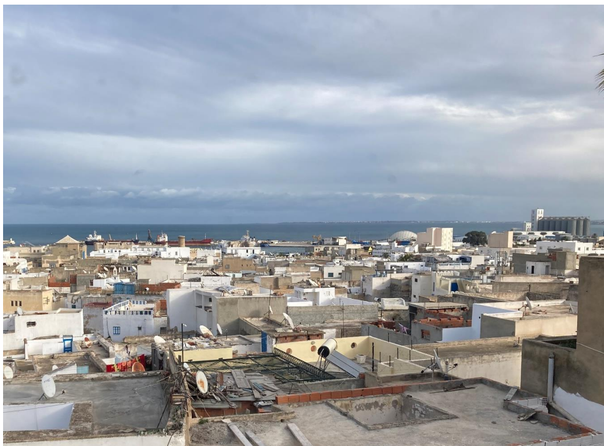
Vue sur la média de Sousse, 3 décembre 2021