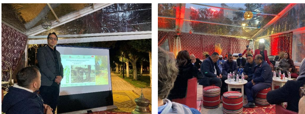
Présentation et visite du Parc Boujaâfar, 3 décembre 2021

Les dispositifs lumineux du parc ont complètement été développés avec des ampoules LED, moins énergivore que les autres types d'ampoule.