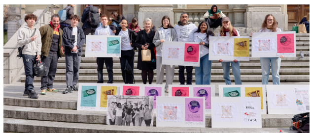
Les frontières invisibles, par l'Association Intercultures et la Maison de Quartier des Faverges

Pour la première fois, la semaine s'est déployée sur 10 jours, du 16 au 25 mars, offrant au public de nombreuses occasions d'échanger, de réfléchir et de se rencontrer autour des différentes réalités du racisme. Conférences, ateliers, projections,