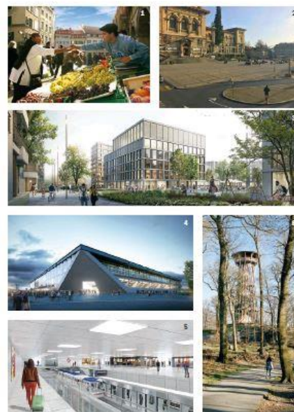
1. Jour de Marché - 2. Place de la Riponne - 3. Future école des Plaines-du-Loup - 4. Futur stade de la Tuilière - 5. Futur métro m3 - 6. Tour de Sauvabelin

Les territoires forains reçoivent des qualités naturelles et paysagères exceptionnelles, mais sont également des lieux de vie et de production – un équilibre qu'il s'agit de préserver, en lien avec le redimensionnement de la zone à bâtir.