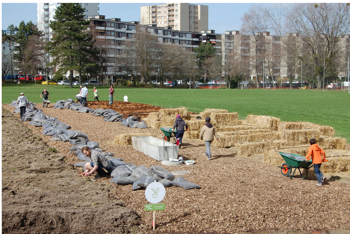
Photo : Chantiers ouverts pour la réalisation du Parc du Loup, avril 2018