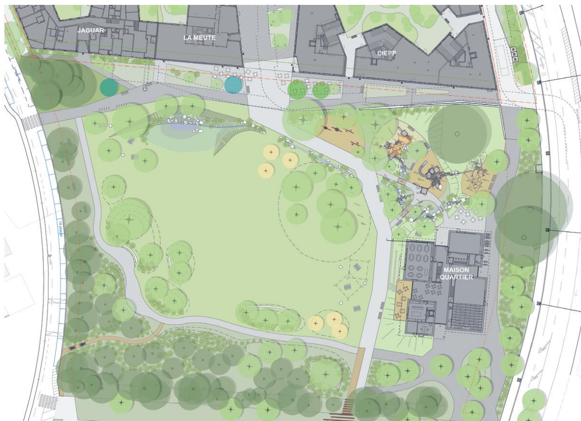
Plan définitif du Parc du Loup, 2022