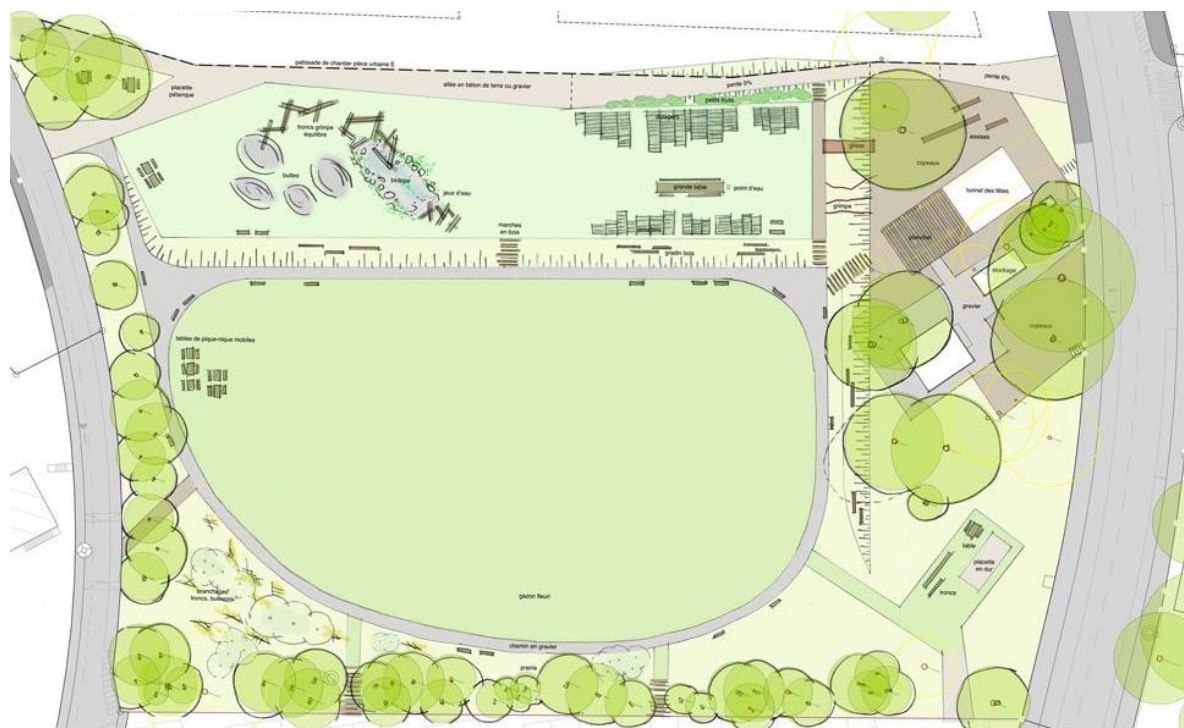
Plan des aménagements tests du Parc du Loup, 2018

début 2018, puis amélioré par les suggestions des participants, avant d'être co-construit au printemps 2018.