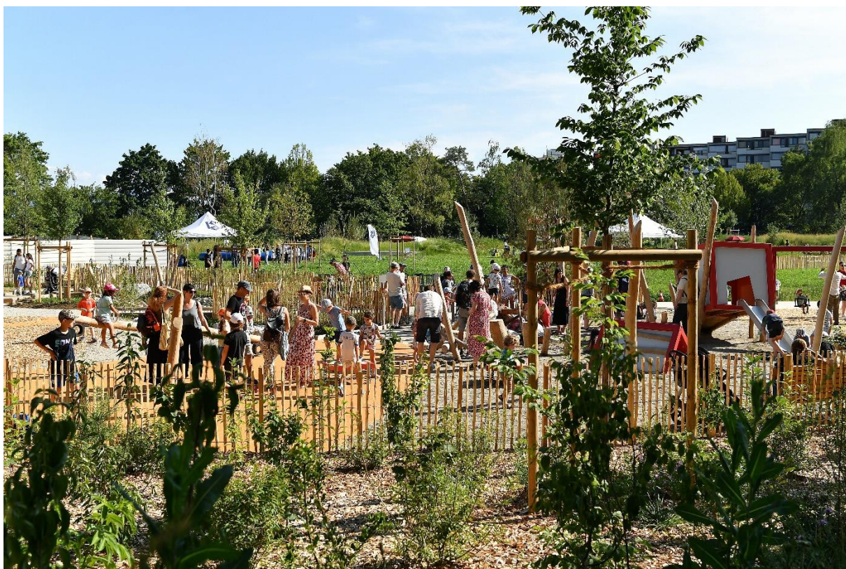
Inauguration du Parc du Loup, 2023