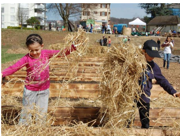
Chantiers participatifs du Parc du Loup, 2018

A l'issue de cette démarche de co-développement, les participants ont pu s'engager dans une démarche de co-construction du parc. Au total, plus d'une centaine de personnes se sont mobilisées pour créer le parc du Loup et 25 familles de jardiniers y cultivent depuis l'été 2018 des potagers gérés par l'Association de quartier de la Blécherette sur un principe de co-gestion. L'ouverture du parc a été inaugurée officiellement en juin 2018 dans le cadre de la fête de quartier qui a réuni une large constellation d'acteurs actuels et futurs.