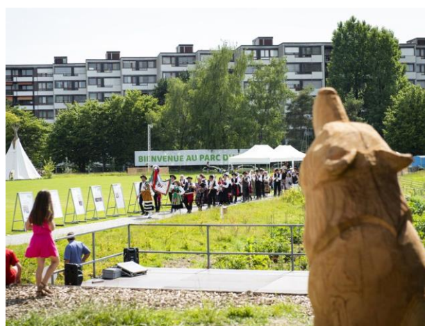
Inauguration du Parc du Loup, 2018