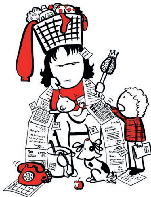
illustration: Manon Roland

Suite à l'appel à témoignages que nous avons lancé au mois de janvier, suivi de la publication de capsules vidéo au mois de mars, nous avons poursuivi notre réflexion sur la charge mentale en plénière. Lors de cette séance réunissant plus de quarante personnes, trois intervenantes nous ont fait part de leurs points de vue.