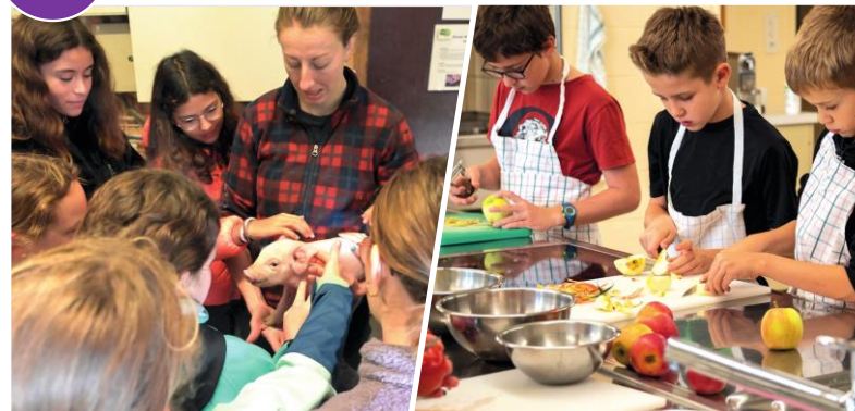
Ateliers Agricultrice (Agrilodge Grange-Verney, Moudon) et Valorisation des produits locaux (CEMEF, Morges).