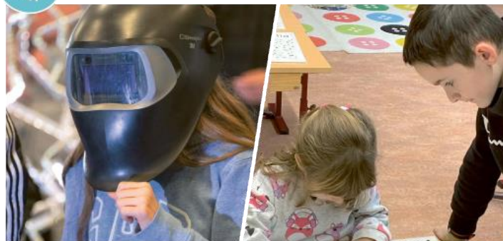
Atelier chauffage pour les filles atelier enseignant de classes enfantines pour les garçons