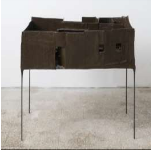
Adios Amigo , 2019. Carton, papier mâché, métal, 87 x 84 x 50 cm.