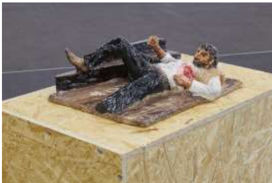
Where are my rifle, my pony and me , 2021. Céramique, peinture, 33 x 26 x 10 cm.