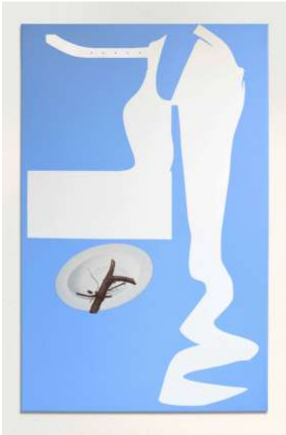
Sans titre, 2017. Acrylique sur toile, 110 x 70 cm.