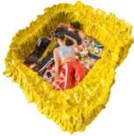
Relax n.2 , 2020. Céramique, peinture, peinture, 20 x 32 x 12 cm.