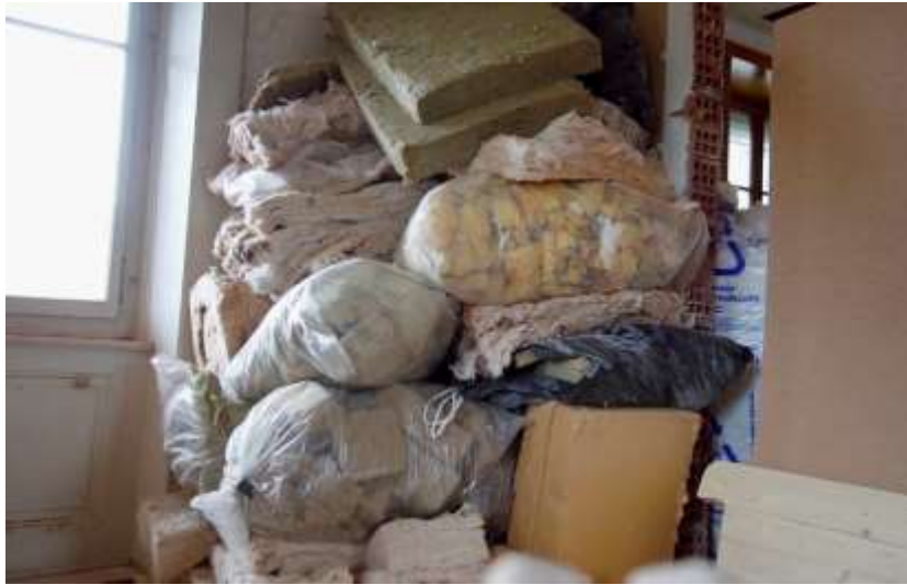
La Maison , 2022. Vidéo digitale (photo extraite du film), 40 min

Cette œuvre d'art vidéo raconte la rénovation d'une maison familiale héritée à la Vallée de Joux. Avec une légèreté caustique dans la voix comme dans le mouvement, la caméra glisse comme les pensées, sur les bâches, les briques et les outils, qui attendent là qu'on les mette en action. Avec un humour aussi ravageur que bienveillant, Sophie Ballmer métamorphose la frustration de l'œuvre jamais terminée, sans cesse recommencée, en dramaturgie contagieuse et existentielle.