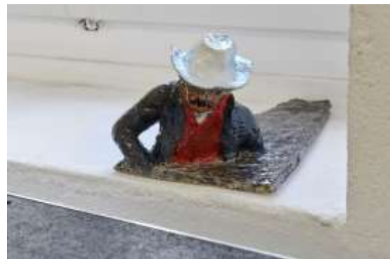
Scram Out , 2021. Céramique, peinture, 20 x 32 x 12 cm.

Les œuvres de Stefania Carlotti reconstituent des environnements et objets, façonnés à la manière de décors ou scènes de films. Elles sont traversées par une atmosphère étrange, préfigurant un effondrement survenu ou imminent. Au-delà des juxtapositions cinématographiques, les œuvres de Carlotti convoquent la vitalité et la nostalgie, l'agitation et la langueur, le cynisme et la tendresse.