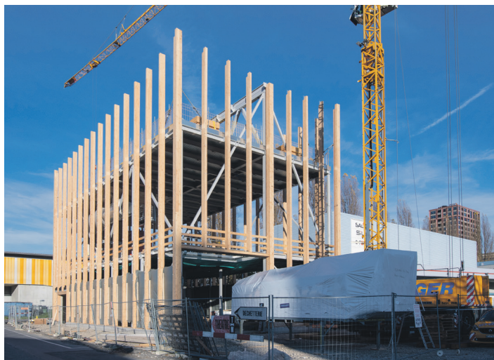
Construction de la centrale de Malley.

② Activation du droit de préemption pour l'acquisition de 15 immeubles, soit près de 350 logements soustraits à la spéculation immobilière, renouvellement de l'aide à la pierre permettant l'abaissement de 25% des loyers de 538 logements à loyers modérés et création de 71 logements à loyer abordable, achat de parts sociales de coopérative (1 million) pour aider à l'accessibilité au logement.