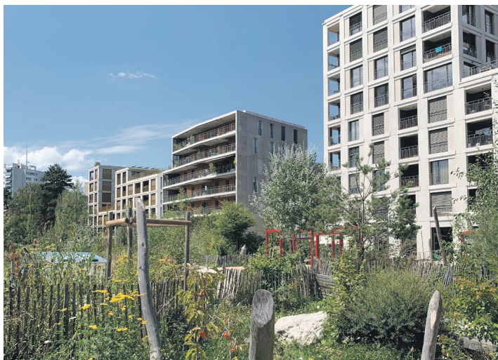
Quartier des Plaines-du-Loup.