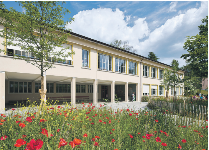
Collège de Montoie.

16 Promotion du sport féminin, notamment accueil du Tour de Romandie féminin en 2022 et 2024 et du Grand Départ du Tour de France féminin en 2026, et organisation de plusieurs événements en marge de l’Euro féminin en 2025.