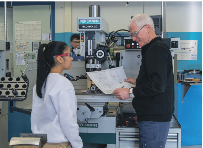
Apprentissage au C-FOR !

26 Développement des cyberprestations comme la mise en place de l’annonce d’un déménagement en ligne auprès du Contrôle des habitants.