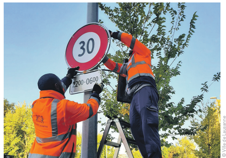
Création de zones à vitesse modérée.

④ Octroi de crédits de 191.5 millions de francs pour assainir énergétiquement 63 bâtiments en plus du musée de l'Hermitage, de la Vallée de la Jeunesse et de l'auberge de Sauvabelin. Diverses prestations offertes pour accompagner les propriétaires privés dans les rénovations énergétiques de leurs bâtiments.