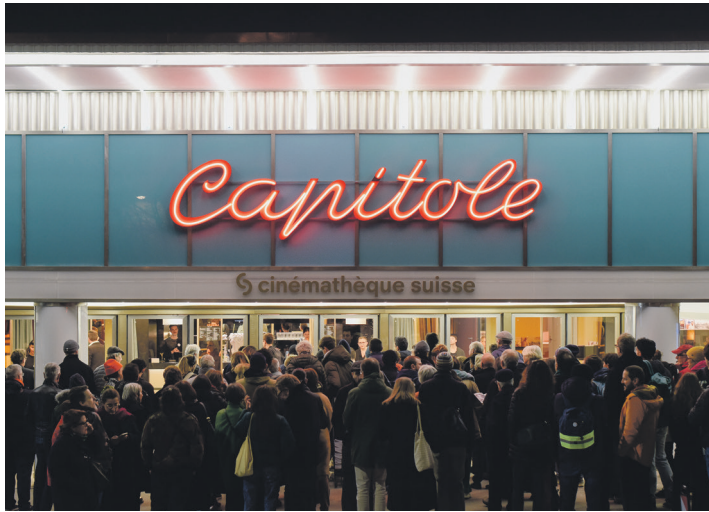
Réouverture du cinéma Capitole.