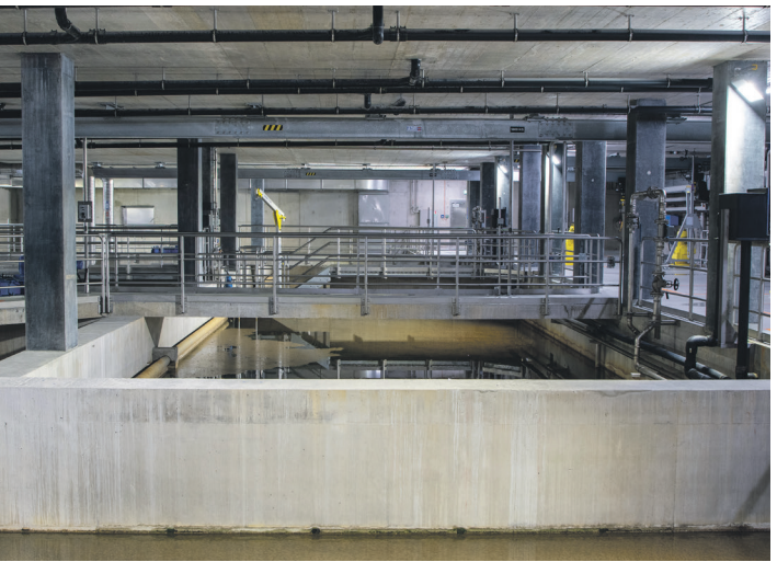
Chantier de la STEP EPURA.

28 Soutien à l’apprentissage par la création de nouvelles places, le lancement d’une nouvelle filière de dessinatrices et dessinateurs industriels au C-FOR !, le déploiement d’une «Junior Team» en cuisine et par le C-FOR ! pour la filière des électriciennes et électriciens de réseaux aux Services industriels de Lausanne.