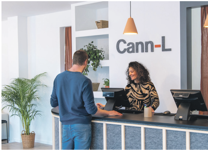
Lieu de vente de cannabis CANN-L.

18 Constructions, rénovations et végétalisations de nombreuses écoles et préaux pour faire face à l’augmentation des effectifs et aux enjeux du réchauffement climatique.