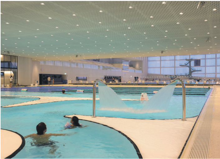
Piscine de la Vaudoise aréna.

14 Inauguration de Pyxis, Maison de la culture et de l’exploration numérique, qui héberge sous son toit plusieurs institutions culturelles lausannoises pouvant mutualiser et partager leurs activités.