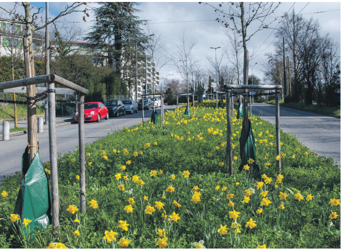
Végétalisation de l’avenue du Grey.

20 Ouverture de CANN-L en 2023, lieu de vente régulée de cannabis, avec plus de 1’700 personnes qui participent à ce projet pilote.