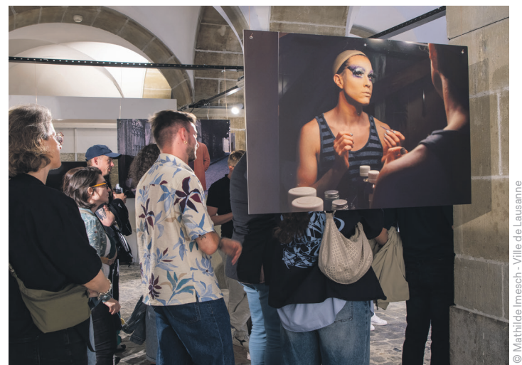
Exposition LGBTQ+ Out of the Box.

⑩ Mise en œuvre de la stratégie touristique 2024-2027 à l'échelle de la région et signature d'une nouvelle convention avec Lausanne Tourisme mobilisant des moyens financiers renforcés, coïncidant avec un record de nuitées hôtelières en 2025.