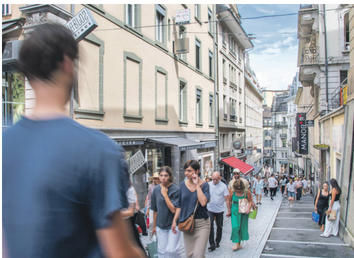
Un centre-ville vivant et animé.

⑧ Création de nouvelles terrasses ou d'agrandissements, gages de convivialité dans les rues lausannoises, qui comptent plus de 600 terrasses aujourd'hui, ainsi que la création de zones de baignade dans le Léman.