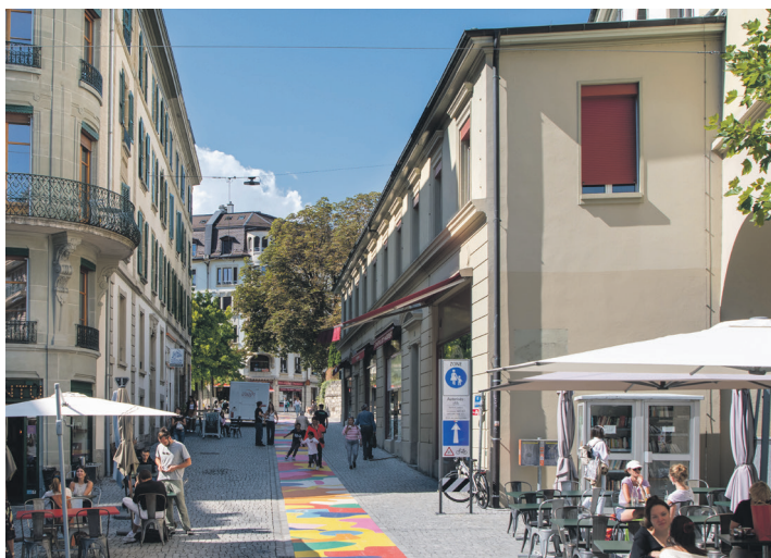
Fresque de la rue Aloïse-Corbaz.

⑥ Réalisation de 41 nouvelles zones modérées avec 13,5 km de voiries passées à 20 ou 30 km/h, développement des itinéraires cyclables avec en moyenne 4 à 5 km de nouveaux aménagements chaque année et installation de 50 bornes de recharge réparties sur 13 sites, pour encourager la transition vers les véhicules électriques.