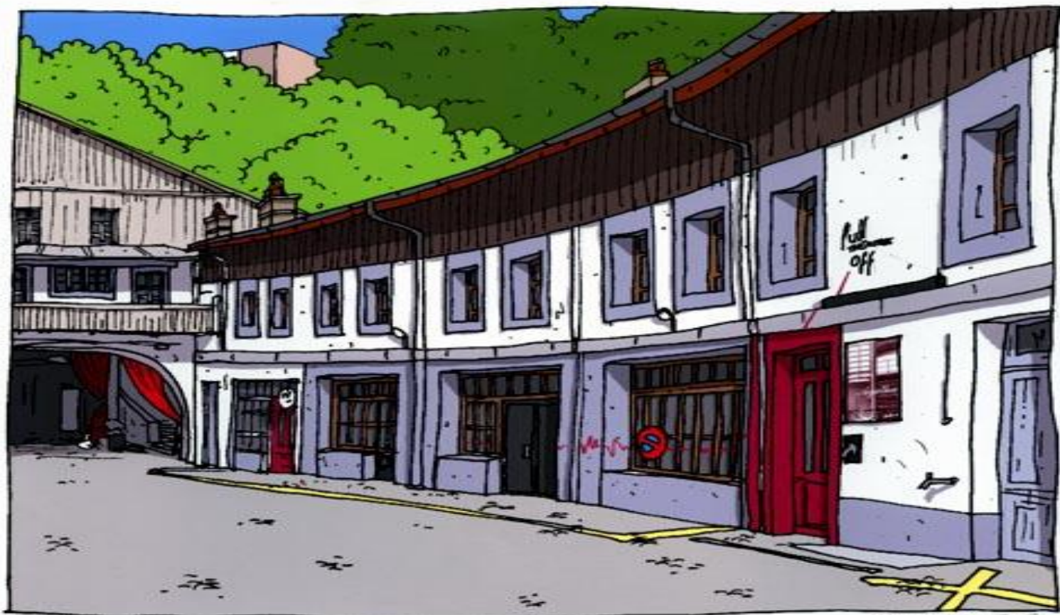
Le Pulloff par Pitch Comment