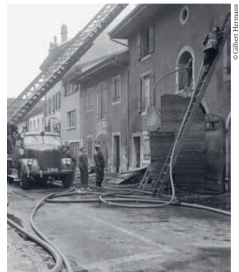
1969, incendie à la rue de Couvaloup