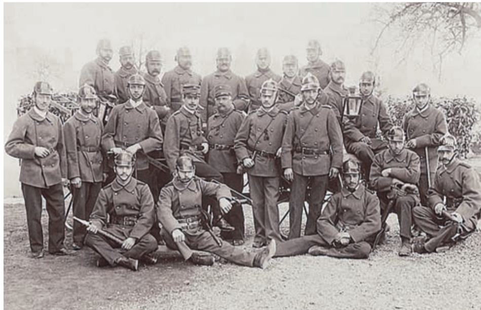
1905, la compagnie des hydrantiers de Morges

Au-delà de la réalité de la vie à la caserne, l'exposition aborde également la représentation