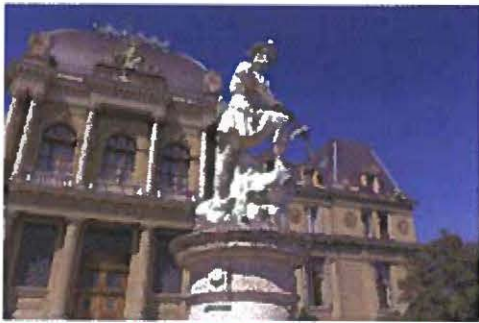
Esplanade de Montbenon, Allée Ernest-Ansermet 2

Avenue du Théâtre 4, Sud-est de la Place, Saint-François