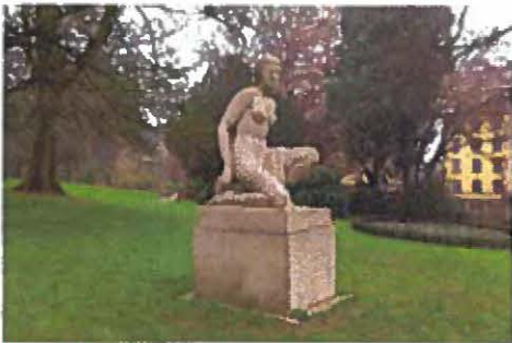
Parc de Mon-Repos Sud-est de la villa