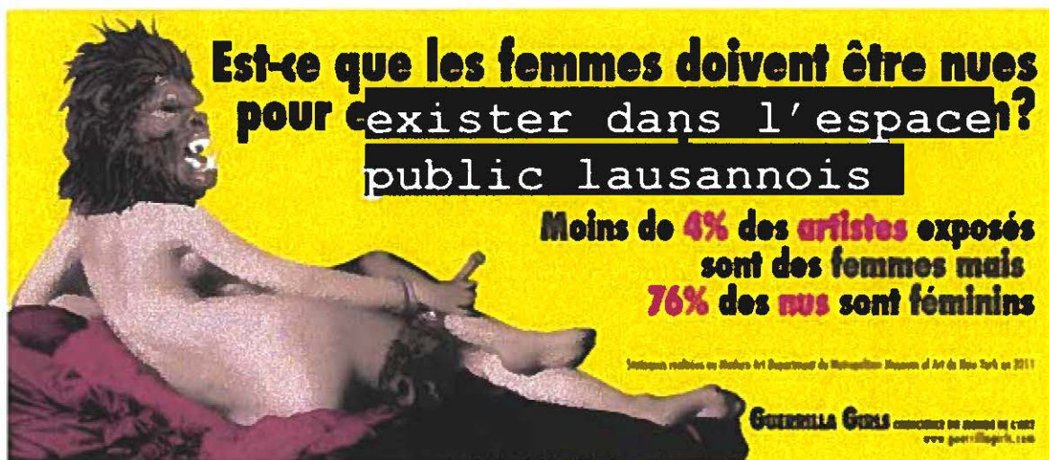
Guerilla Girls, affiche, d'après une affiche originale de 1985, après une étude au MET New York en 2011, ici détournée (texte original : « Est-ce que les femmes doivent être nues pour entrer au Metropolitan Museum ? »)

Statues certes allégoriques mais néanmoins explicites de corps de femmes, ou de figures masculines célébrées malgré l'évidente ambiguïté dont elles sont porteuses. Pour les nommer, il s'agit notamment de deux statues de Milo Martin, d'une statue d'Antonin Mercié et de deux statues par Pierre Blanc. 2