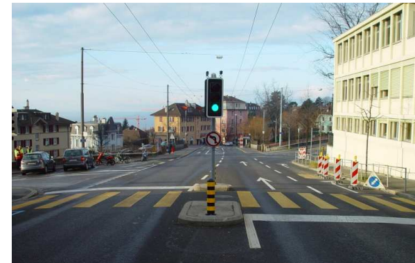
Feux supprimés au PP Dufour-Belvédère