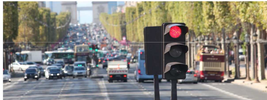
Un feu tricolore sur les Champs-Élysées à Paris, le 23 septembre 2015.

Plusieurs villes, comme Nantes, Bordeaux et bientôt Paris, ont décidé de retirer les feux tricolores pour fluidifier le trafic et améliorer la sécurité.