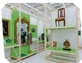
Le Musée historique explore toutes les facettes de la nature en ville. CLAUDINE GARCIA