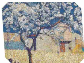
Il fait toujours beau chez Achille Laugé. À voir à l'Hermitage. PETER SCHÄLCHLI