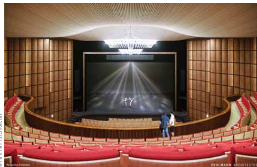
La salle de spectacle telle que le public pourra la découvrir dès septembre.

Avant le début des travaux, le lustre a été complètement démonté. «Il est tellement volumineux qu'il ne passait pas les portes!» Il est actuellement en train d'être restauré et les ampoules vont toutes être remplacées par des LED. Le public pourra admirer dès septembre le résultat de cet immense chantier qui aura duré plus trois ans.