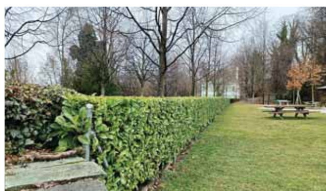
A la Promenade Dentan, les arbustes exotiques...