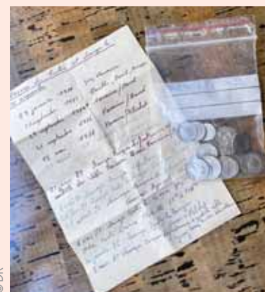
Chaque réparation était notée sur ce billet.

Lorsque l'équipe de Beaulieu a démonté le lustre avant sa rénovation, elle a trouvé un billet dans un tube, au centre de la suspension, accompagné de quelques pièces de monnaie. «Lors de chaque réparation, entre 1970 et 2003, l'électricien en charge du contrôle du lustre notait la date, son nom ainsi que l'objet de la réparation. Il laissait également une pièce de monnaie, sans doute comme porte-bonheur», explique la directrice du théâtre.