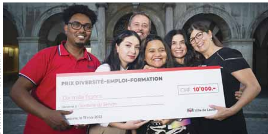
L'équipe de la garderie du Servan a reçu un chèque de CHF 10'000.-.

La Fondation Bellet qui chapeaute cette structure est sensible à cette