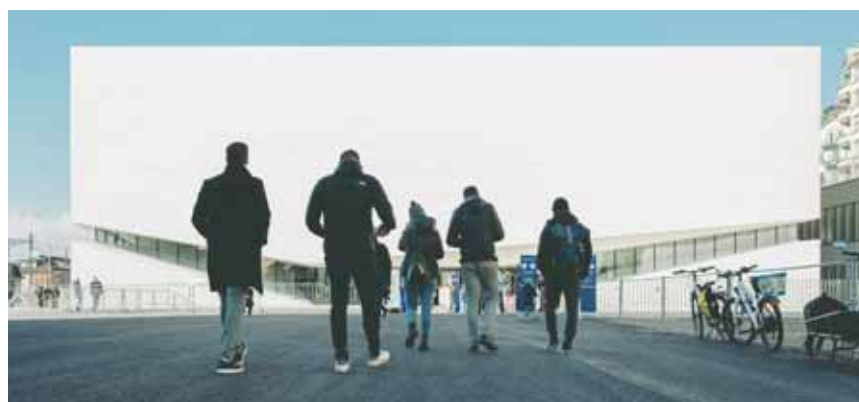
Deux journées portes ouvertes ont eu lieu en novembre dernier.

Informations pratiques: Samedi 18 juin de 10h à 1h Dimanche 19 juin de 10h à 20h Plateforme 10 Place de la Gare 17 → www.plateforme10.ch