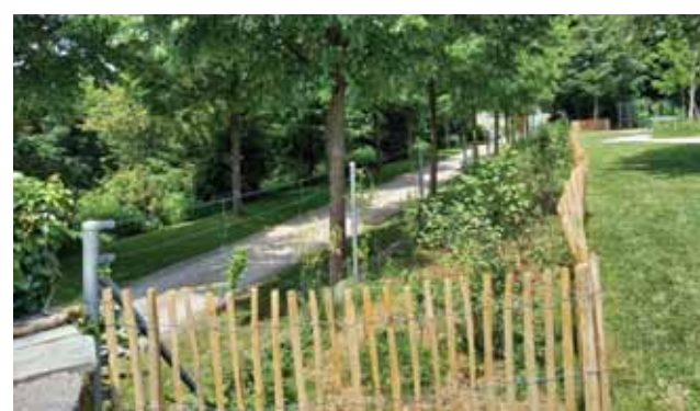
... ont été remplacés par des indigènes.