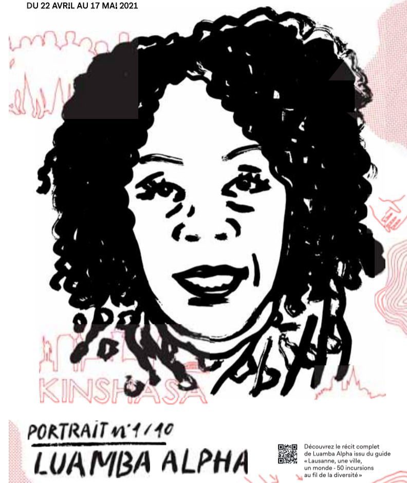
© Agence-Now* - Illustrations: Alex Pointet

UNE EXPOSITION URBAINE À L'OCCASION DES 50 ANS DU BLI DU 22 AVRIL AU 17 MAI 2021