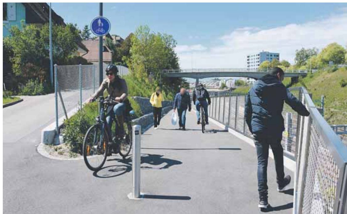
Le plan climat prévoit d'augmenter fortement les déplacements à pied ou à vélo.

Afin de favoriser la mobilité douce, bénéfique pour la santé et pour la lutte contre la pollution de l'air, la Ville a poursuivi le développement d'aménagements cyclables. Ce développement était d'autant plus important cette année qu'il a fallu accompagner les effets de la pandémie afin que le trafic ne se reporte pas essentiellement sur la voiture. En effet, la