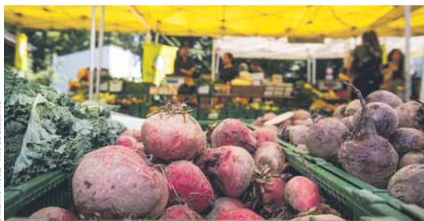
Une offre fraîche et locale tous les vendredis.

Vous avez ici une offre fraîche et locale, et parfois bio. Les stands vous proposent notamment des fruits et légumes, des produits de boucherie, de fromagerie et de boulangerie. Cerise sur le gâteau, des vigneron et des brasseurs de