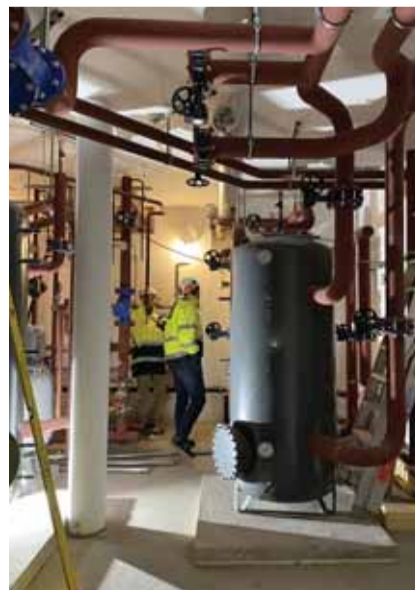
Deux collaborateurs des SiL vérifient la réalisation d'une des 5 chaufferies de la pièce urbaine E.

— ➔ Plus d'infos sur www.lausanne.ch/geothermie