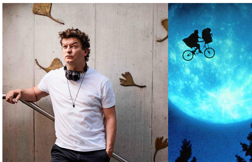
Lord Betterave à Carouge et à Vevey, «E.T.» à Neuchâtel.