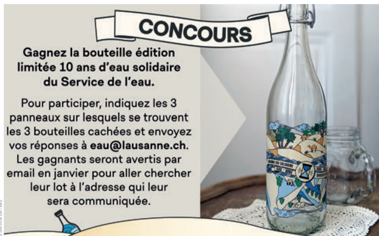
Gagnez une bouteille étiquetée «eau solidaire» en visitant l'exposition.

A l'occasion du dixième anniversaire du partenariat, le Service de l'eau propose de découvrir l'expo-