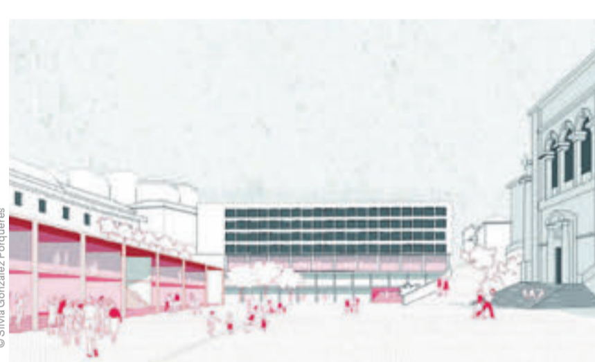
Une représentation du projet gagnant In-between.

Deux autres projets, classés en deuxième et troisième position, ont particulièrement séduit le jury. Ensemble, ces trois propositions vont permettre à la Ville de dessiner les futures images direc-