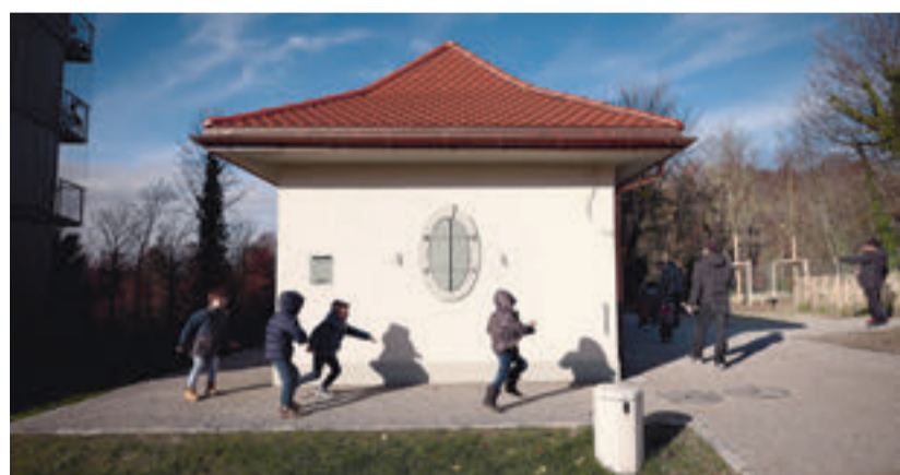
L'édicule des Falaises a été rénové pour devenir un espace communautaire dans le quartier.

QUARTIERS — Promouvoir la cohésion et un cadre de vie agréable auprès des nouveaux habitants et usagers des Falaises, voilà l'objectif poursuivi par la Ville et ses partenaires, La Maison ouvrière et la Société Immobilière Lausannoise pour le logement SA. Le samedi 30 novembre, lors du lancement de la future «Association des habitants des Falaises», l'édicule et les jardins potagers du complexe immobilier – qui seront gérés par ladite association – ont été inaugurés. Parmi les quelque 70 participants, une cinquantaine ont déclaré être intéressés à devenir membres. | AI