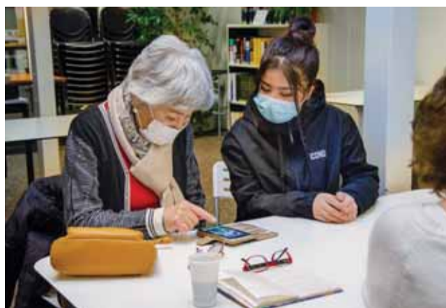
Des occasions de rencontres entre générations.

Autre quartier, autre type de rendez-vous. Dans le cadre du Budget participatif de la Ville, l'association L'Escale Des Voisins anime plusieurs ateliers tout public – créatifs, d'écriture, de lecture – jusqu'au mois