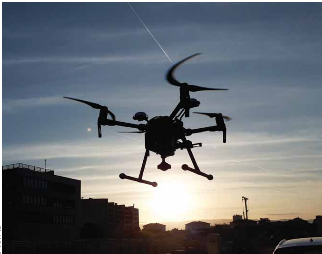
Un drone équipé d'une caméra thermique survole le réseau de chauffage à distance dans les quartiers de Pierre-de-Plan, Boissonnet et des Bossons durant les nuits de février et mars.

Pour garantir des images de qualité, elle doit absolument se dérouler en hiver, car cette période de