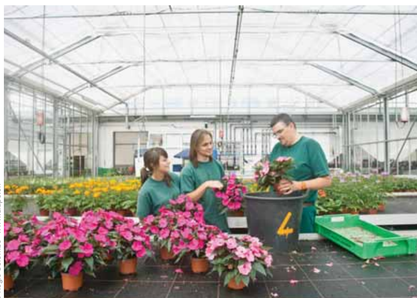
Deux jeunes en apprentissage s'initient aux secrets de l'horticulture avec leur formateur dans une serre située à la Bourdonnette.

ADMINISTRATION — La Ville de Lausanne forme plus de 200 apprenties et apprentis dans plus de 30 métiers aussi divers que les métiers de la terre et de la vigne, la construction des routes, l'accueil de jour des enfants et des ados ou de la mécanique. Plus de 140 formatrices et formateurs les suivent dans cette première étape de leur parcours professionnel. Cet environnement leur offre un cadre propice au développement de leur savoir-être et de leurs savoir-faire, à l'âge charnière qu'est le passage de l'adolescence à l'âge adulte.