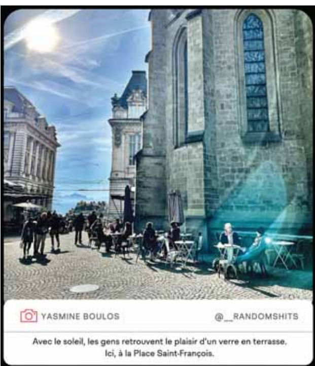
YASMINE BOULOS @_RANDOMSHITS

Difficile de faire son choix parmi les livres de seconde main proposés par la Librairie de La Louve.