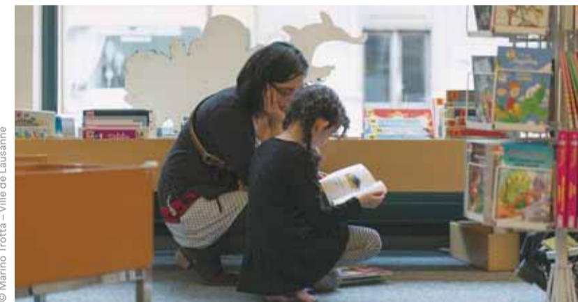
Choisir un livre, c'est du sérieux! Ici, une mère et sa fille à la Bibliothèque Jeunesse.

→ Toutes les infos sur www.lausanne.ch/lire