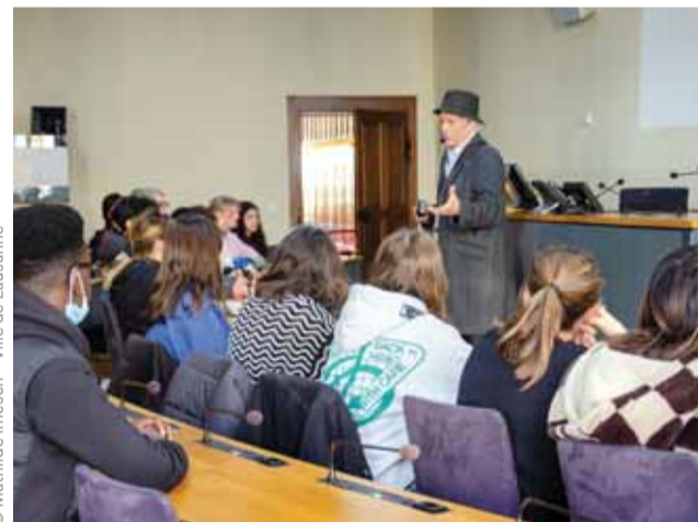
Dans la salle du Conseil communal, un guide passionné raconte une foule d'anecdotes aux jeunes présents.

Deviens l'actrice ou l'acteur de ta ville – c'est dans cet esprit que la Ville de Lausanne propose aux élèves du secondaire de découvrir les institutions politiques lausannoises. Concrètement il s'agit de leur proposer des visites englobant les «lieux de pouvoir» que sont la place de la Palud, l'Hôtel de Ville et les salles des autorités communales. En amont, le corps enseignant les prépare et élabore avec eux une liste de questions sur le fonctionnement politique ou sur un thème d'actualité. Ces visites se déroulent en deux temps, tout d'abord une personne du MDA (mouvement des aînés) leur fait découvrir la Palud, le bâtiment de l'Hôtel de Ville puis la salle du Conseil communal. C'est à ce moment-là qu'intervient une ou un membre de la Municipalité qui explique aux jeunes le fonctionnement des institutions lausannoises. En alternance, les membres de la Municipalité se