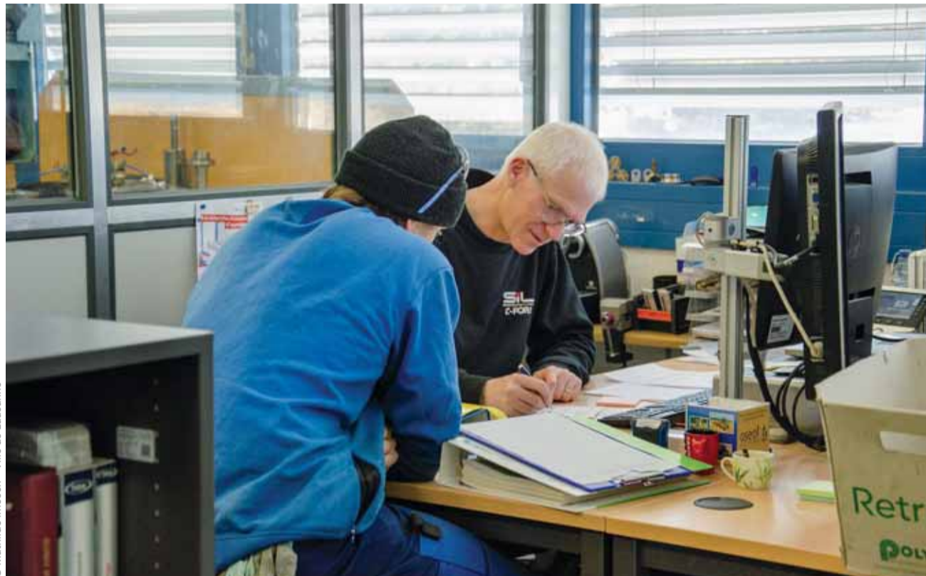
Au C-FOR!, les jeunes évoluent sous l'œil bienveillant de spécialistes.