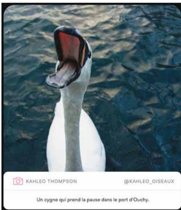
KAHLEO THOMPSON @KAHLEO_OISEAUX

À Plateforme 10, une passerelle lie le bâtiment du Musée cantonal des Beaux-Arts et celui qui abrite Photo Elysée et le Mudac.