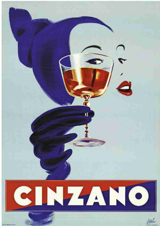
Ci-contre, une affiche pour le Cinzano, apéritif italien emblématique (1950) et, ci-dessous, l'annonce d'une loterie à la Casa d'Italia de Lausanne en 1932.

Ordre: 1088324 Référence: 81868024 N° de thème: 032.017 Coupure Page: 2/2