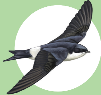
6 Hirondelle de fenêtre