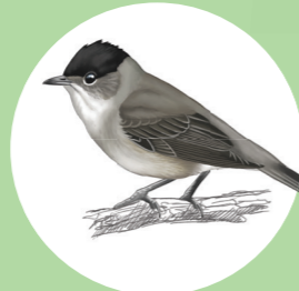
11 Fauvette à tête noire