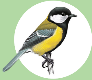
1 Mésange charbonnière