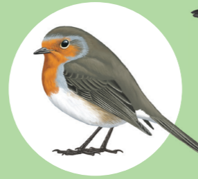
10 Rougegorge familier