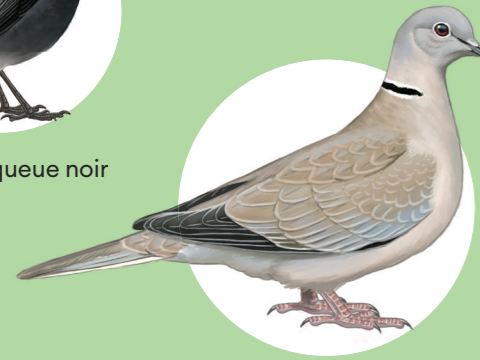
3 Tourterelle turque