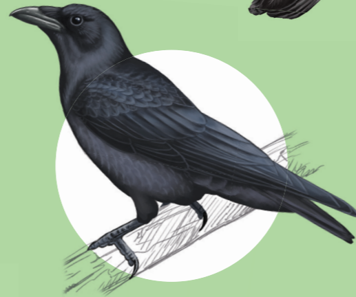
16 Corneille noire