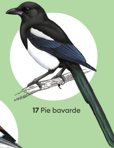
17 Pie bavarde