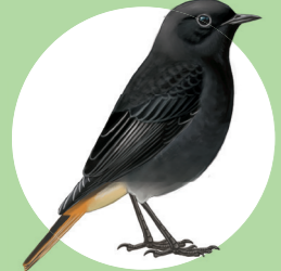
14 Rougequeue noir