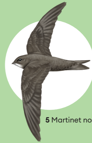
5 Martinet noir