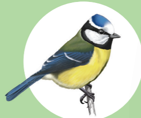
2 Mésange bleue