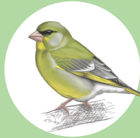
13 Verdier d'Europe