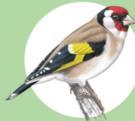
9 Chardonneret élégant