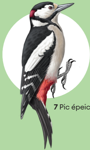
7 Pic épeiche