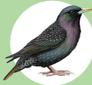
8 Etourneau sansonnet