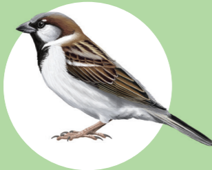
18 Moineau domestique