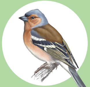
12 Pinson des arbres