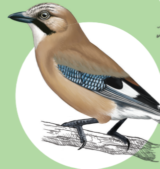
19 Geai des chênes