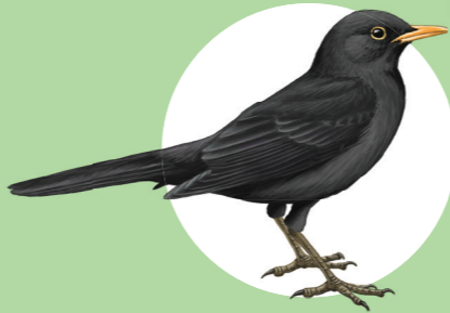
15 Merle noir