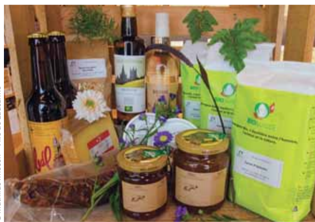
Des produits locaux et respectueux de l'environnement.

Courant décembre 2021, les projecteurs se sont tournés vers l'entreprise Ça Rûpe et ses fameux taillés revisités. Puis le local a accueilli la plateforme TAOU et ses prestations d'achats groupés de produits régionaux. Février verra le rideau se lever avec l'arrivée des producteurs BIO VAUD et leurs produits labellisés d'ici puis à la Cave de la Côte. Le programme continue avec une présentation des automates VAUD+, distributeurs automatiques de produits locaux. Avis aux producteurs et productrices des secteurs associatifs ou privés: toutes les nouvelles propositions sont les bienvenues. Parmi les conditions, la matière