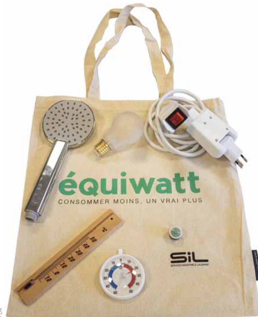
Le kit équiwatt contient six objets qui vous permettent d'économiser jusqu'à 100 francs par an.