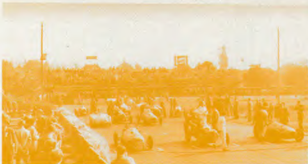
Avoir des loisirs, cela permet par exemple d'assister à des courses automobiles comme ce Grand Prix de Lausanne en 1914.