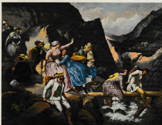
Au XIX e siècle, alors que les ouvriers de la révolution industrielle se battent pour faire diminuer leurs horaires de travail, les classes favorisées prennent du bon temps et découvrent les joies de la montagne, à l'instar de ces Promeneurs dans la région de la chute de l'Eau noire (entre la vallée de Chamonix et le Valais) représentés par Johann Konrad Zeller vers 1850 (huile sur toile). Collection Musée national suisse.