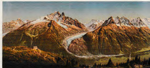
Un même regard panoramique sur le massif du Mont-Blanc (depuis la Flégère) à environ un siècle de distance.