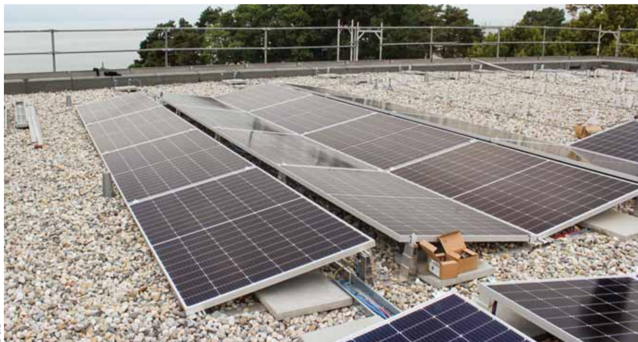
Pour respecter l'architecture d'origine, les panneaux solaires sont posés en dôme est-ouest et sont ainsi très discrets.

Le toit de la salle principale cumulait de nombreux défis: une structure de tubes extérieure qui soutient le bâtiment et une cage de scène très haute à l'ouest qui fait de l'ombre. Nous avons tiré parti de cette configuration en plaçant les panneaux hors des zones d'ombre et en laissant la végétation partout ailleurs.