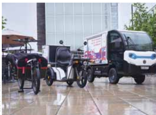
Un vélo Carvelo2go et les deux véhicules SMARGO, montrés au Flon.