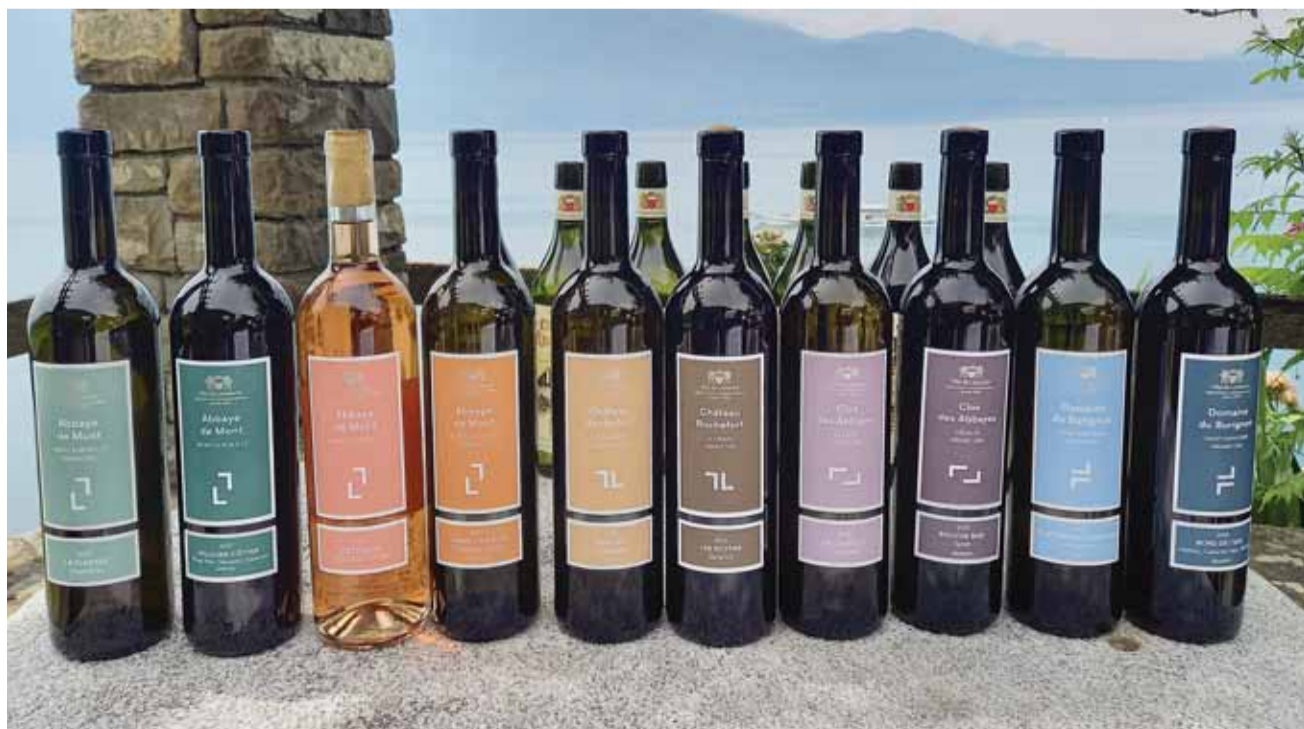
La Sélection L se pare de nouvelles étiquettes et se recentre sur quatre domaines pour mieux exprimer leur typicité.