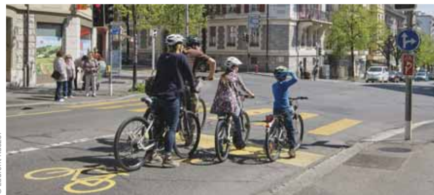
Une famille à bicyclette dans le quartier sous-gare.

En lien avec le Plan climat, la Ville veut accélérer le mouvement: qu'en 2030, la part du vélo atteigne 15% dans les déplacements en ville, contre 2% en 2015. La Municipalité est convaincue que pour amener les gens au vélo, il faut d'abord les rassurer en développant un réseau d'itinéraires