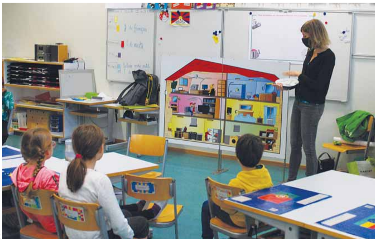
Qui saura le mieux économiser l'énergie dans sa maison? Les enfants sont tout aussi futés que les adultes pour trouver des astuces pour diminuer leur consommation. www.equiwatt-lausanne.ch

Conçu pour des enfants de huit ans (environ), l'atelier d'1h30 se déroule en deux étapes. La classe est séparée en deux groupes. Le premier sort visiter le bus, tandis que l'autre reste en classe. Par équipe, ils doivent trouver les bons écogestes à réaliser dans chaque pièce et les présenter à leurs camarades. «Ils sont très malins et, généralement, ils arrivent rapidement à déduire quel moyen leur permet de diminuer la consommation d'énergie», continue notre spécialiste. Pendant ce temps, à l'extérieur, une partie du groupe pédale sur des vélos pour allumer des gyrophares tandis que l'autre relève un défi à l'intérieur du bus: identifier tous les appareils qui consomment de l'énergie (bouilloire, console de jeux, etc.) et les éteindre, un à un, jusqu'à ce que le wattmètre indique zéro. Oui, même le mode veille. «Les enfants adorent cette activité car c'est comme chercher un trésor. Sauf que là, c'est de l'énergie à supprimer», conclut-elle. | FA