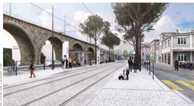
Une image du futur tramway à Malley.

Ce nouveau mode de transport va permettre de répondre de façon durable et respectueuse de l'environnement aux développements de ce secteur en forte expansion. Il complètera le réseau de transport