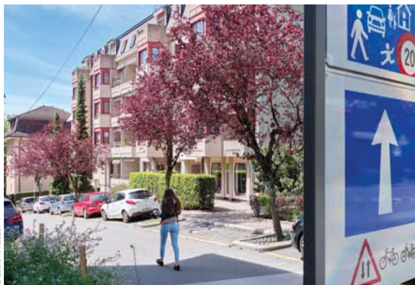
Une zone de rencontre à la rue du Crêt.

Limiter les nuisances sonores, décourager le trafic de transit et