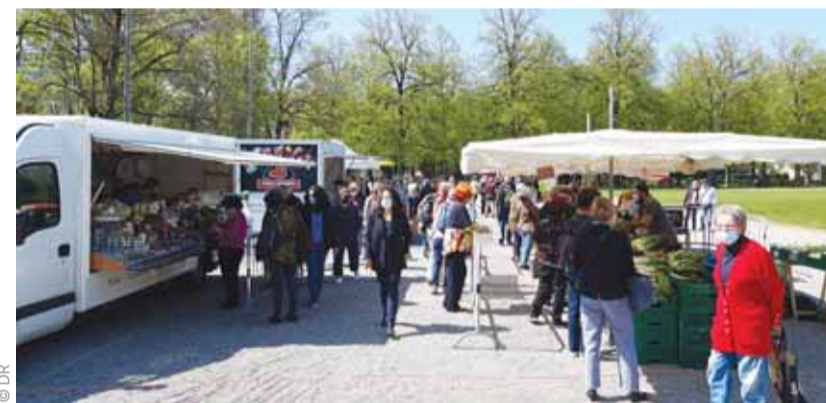
Le marché de la place de Milan.