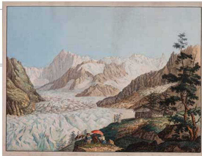
Ci-dessus: «Château de Montenvers» par Carl Hackert, 1781. Ci-dessous à gauche: chaussure du «mercenaire du Théodule», cuir, vers 1600. A droite: pierre calcaire.

«Eternal Sunshine», Ariana Grande, Island