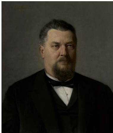
Félix Vallotton, Portrait d'Antoine Vessaz , huile sur toile, 1890

En 1890, le jeune Félix Vallotton (1865-1925) exécute le portrait d'Antoine Vessaz (1833-1911), alors la personnalité politique la plus puissante du canton de Vaud, deux ans avant une chute aussi brutale que l'ascension de ce Tycoon avait été fulgurante.