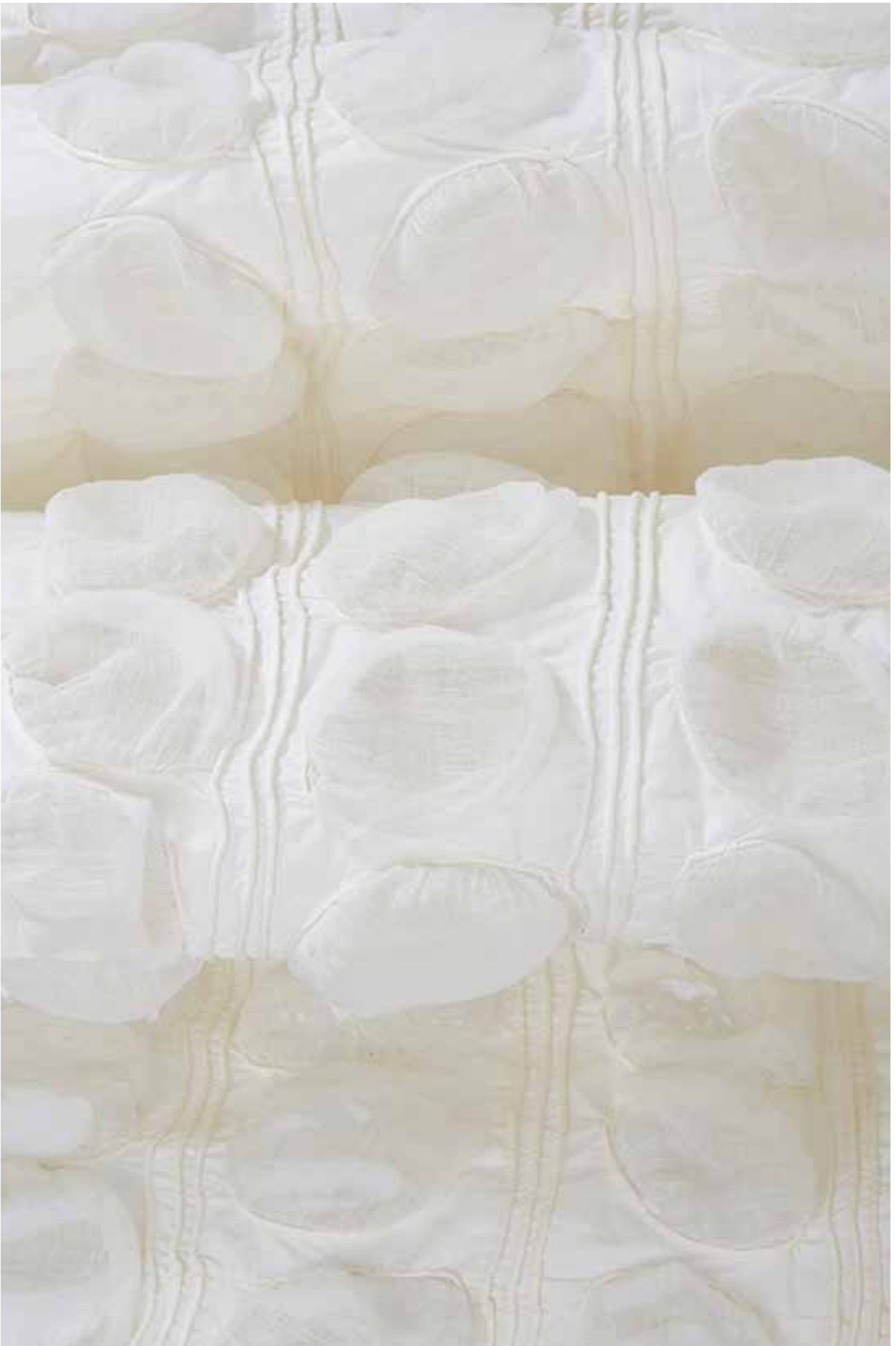
Détail d'un vêtement de l'exposition.