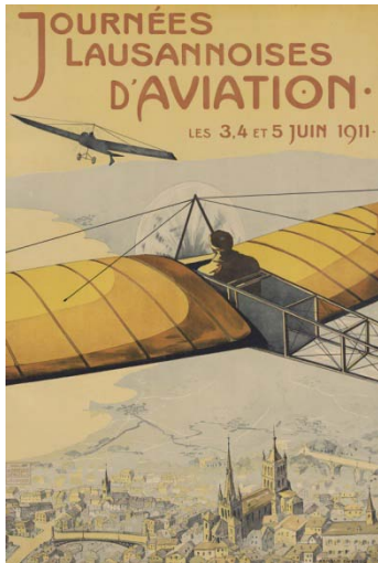
Arnold Cuenod, affiche lithographiée, Dénéreáz-Spengler & Co, 1911