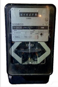
Compteur mécanique Index en kWh

Aucune manipulation à effectuer. Reporter les chiffres.