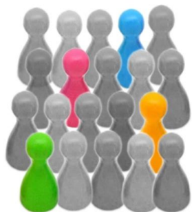
Membres du jury : 4 représentant-e-s