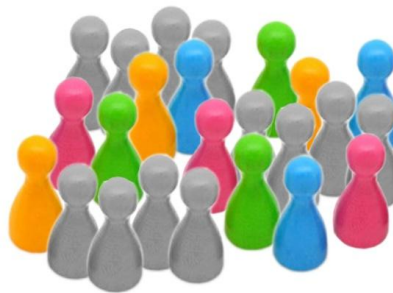
Spécialistes conseil : 12 représentant-e-s