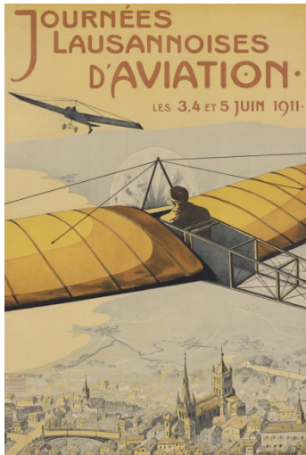
Arnold Cuenod, affiche lithographiée, Dénéreáz-Spengler & Co, 1911