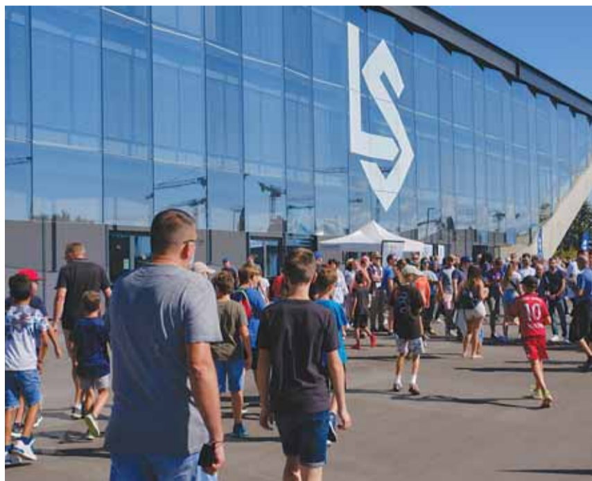
Le stade lors de son inauguration publique le 12 septembre.

Les jurés ont noté «les moyens simples et les solutions éprouvées, mais intégrés de manière créative dans un bâti cohérent et robuste qui parvient à se démarquer». Ils ont relevé la parfaite mise en œuvre des parois inclinées. Ils ont égale-