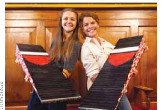
Un travail d'assemblage qui a pris cinq jours.

PRATIQUE — La collaboration avec l'association RampToGo se concrétise avec la construction d'une rampe d'accès amovible en LEGO pour les personnes en situation de handicap.