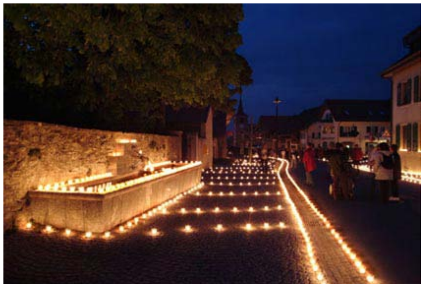
Allumons Assens ! 1 er mai 2004