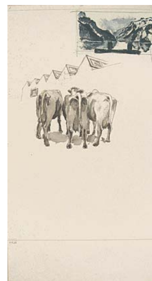
Vaches devant un musée

le chapitre CHF 12.-, (2 chapitres CHF 22.- / 3 chapitres CHF 30.-)