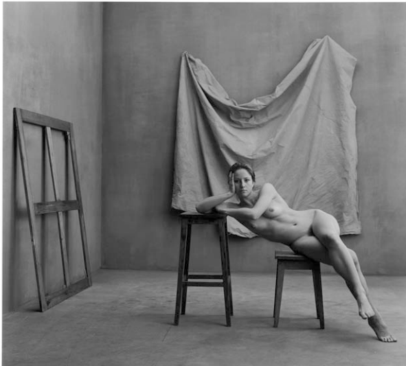
La pose, Lausanne, 2005