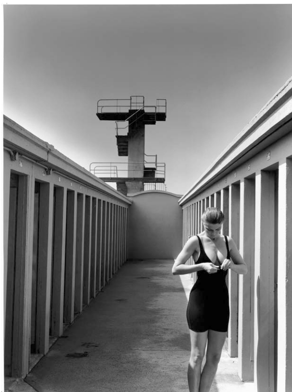
Bain des Pâquis, 1991