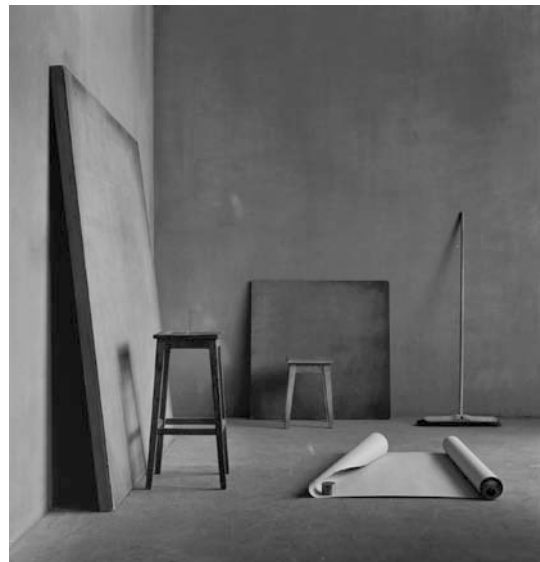
Silence IX, 2007