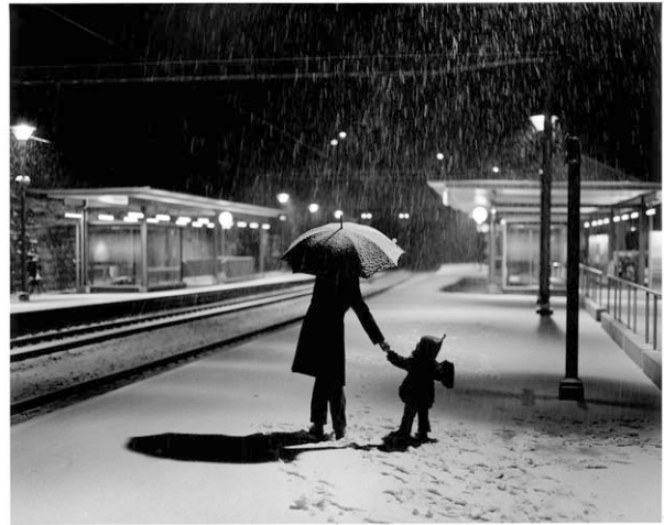
La gare de Lutry, 2008 Bain des Pâquis, 1991