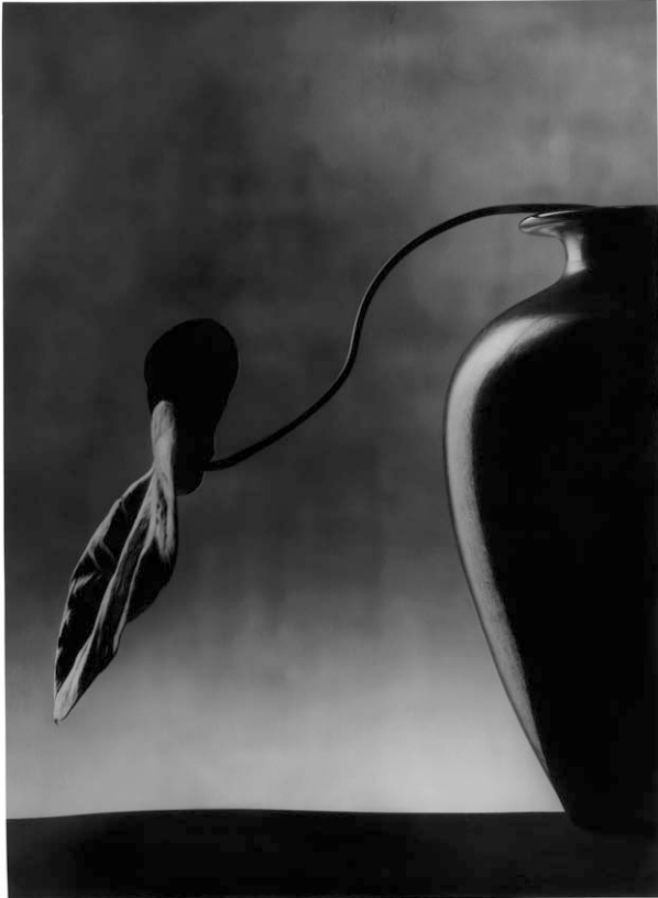
Vase noir, 1988