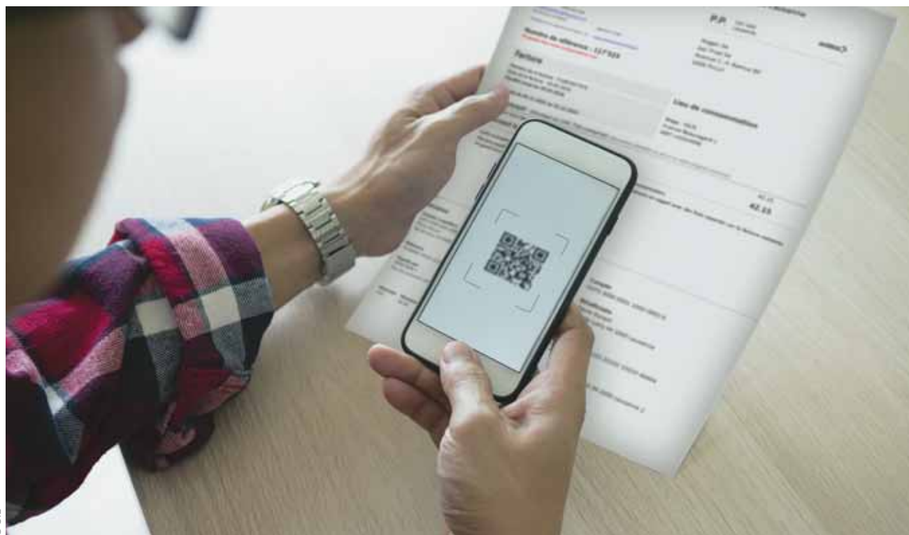
Les factures des SiL comportent dorénavant un code QR qu'il suffit de scanner depuis son application de paiement mobile. Facile et rapide.

La facture électronique, qu'on appelle aussi eBill, existe depuis de nombreuses années et se révèle également très pratique. Comme elle est dématérialisée, on ne peut pas la perdre. On y accède via le portail eBill de son compte bancaire ou postal en ligne. Après s'être inscrit auprès de la société émettrice de facture, les documents sont envoyés régulièrement avec les échéances de paiement. On peut les