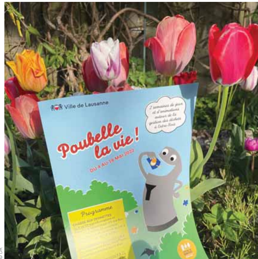
Un groupe du quartier a imaginé un programme d'animations autour de la gestion des déchets.