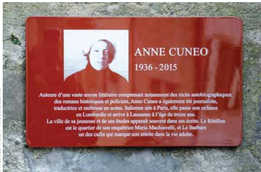
La plaque d'Anne Cuneo a été posée début avril.

Depuis le 4 avril, une plaque commémorative en l'honneur de la populaire romancière, journaliste, traductrice et réalisatrice, disparue en 2015, trône sur le mur près de l'accès au café lausannois Le Barbare. Anne Cuneo disait de celui-ci qu'il était «son premier café d'adulte» dans son récit autobiographique Portrait de l'auteur en femme ordinaire . C'est ce lieu, ayant marqué sa jeunesse, que la Ville a choisi pour lui faire honneur.