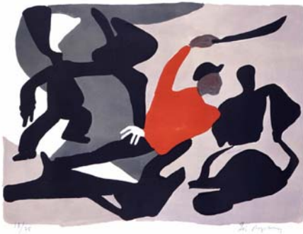
Deux nus , encre sur papier, vers 1953 Gymnastique chinoise , lithographie, 1961

Fondée après le décès de l'artiste en 1974, l'Association des Amis de Géo Augsbourg, composée de proches de l'artiste, est la dépositaire d'un très important fonds d'œuvres peintes, dessinées et gravées, d'ouvrages originaux, de photographies et d'une riche documentation relative à cette figure exceptionnelle de la vie artistique en Suisse au 20 e siècle.