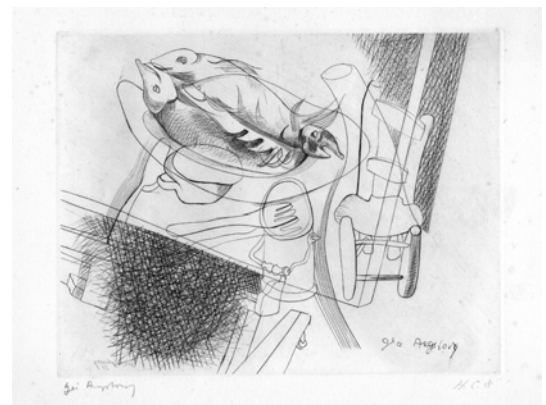
Poissons , burin, 1951