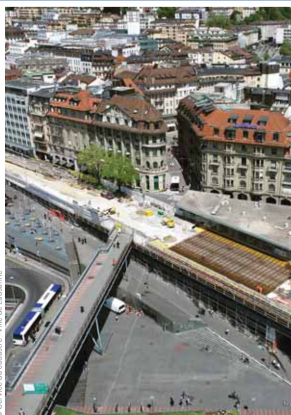
© Service du cadastre - Ville de Lausanne

PRATIQUE — Alors que les travaux progressent, la prochaine étape significative sera dédiée à la réalisation de l'étanchéité du pont ainsi qu'à la préparation des trottoirs, avec les bordures, l'intégration des conduites électriques et le béton de remplissage. Pour mener à bien cette phase, les passages vers le Grand-Pont depuis la passerelle du Flon et les Escaliers du Grand-Pont seront fermés du 27 juin au 13 juillet. En parallèle, le passage de la passerelle du Flon vers la place Bel-Air restera fermé jusqu'à la fin des travaux. En compensation, un passage sera ouvert entre la passerelle du Flon et le bas de la rue Pichard à compter du 13 juillet.