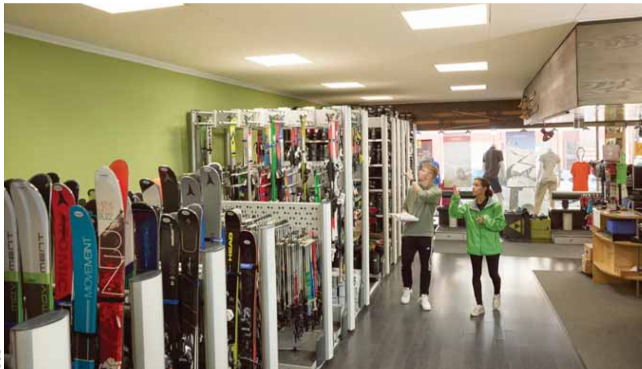
Les PME peuvent contacter equiwatt pour recevoir une visite gratuite pour évaluer le potentiel d'économies d'énergie de leur entreprise.

Si vous engagez des rénovations d'un montant supérieur à CHF 1000.-, qui vous permettent de réaliser au moins 15% d'économies d'énergie pour les éléments rénovés, vous pouvez bénéficier de cette subvention. Pour cela, il vous suffit d'envoyer la copie des fac-