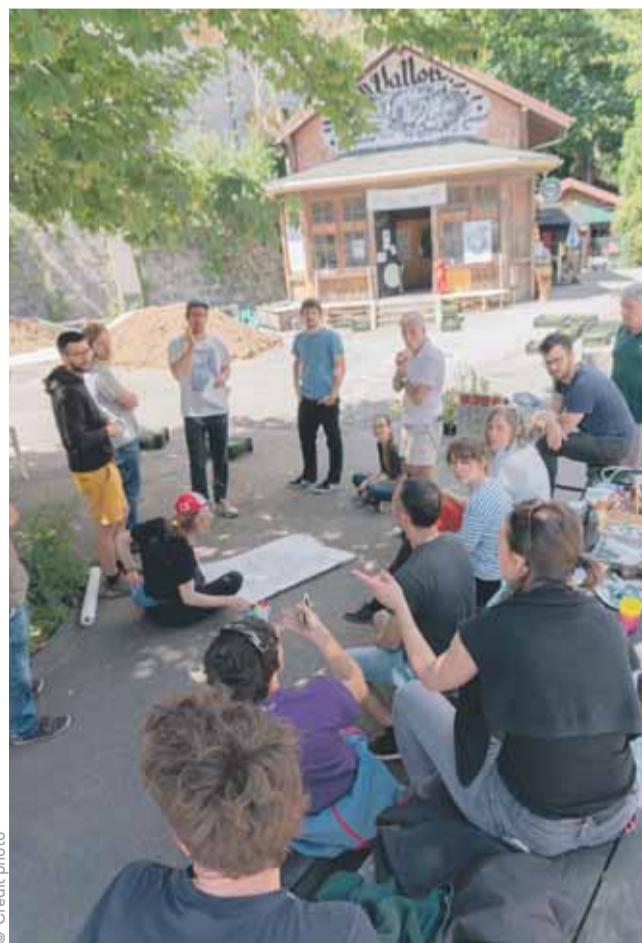
Une zone d'animations et de rencontres.

C'est à l'occasion de trois temps forts que l'aménagement a pris forme avec l'aide des personnes du quartier, qui ont elles-mêmes retiré l'asphalte et planté de la végétation, délimité la zone avec de la peinture et installé du mobilier urbain.