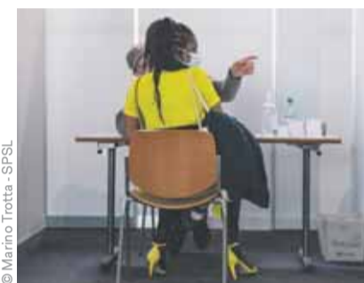
Le parcours dure trente minutes.

→ https://coronavax.unisante.ch → Hotline cantonale: 058 715 11 00