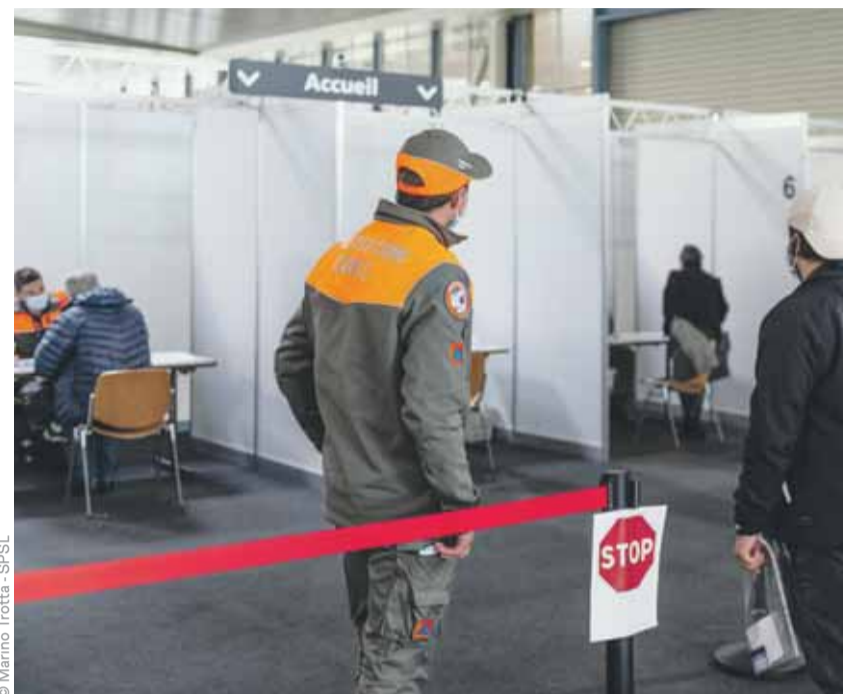
La protection civile gère l'admission, le parcours à l'intérieur et les sorties.

Très clairement! Là où nous voyons bien à quel point les vaccinations portent leurs fruits, c'est dans les