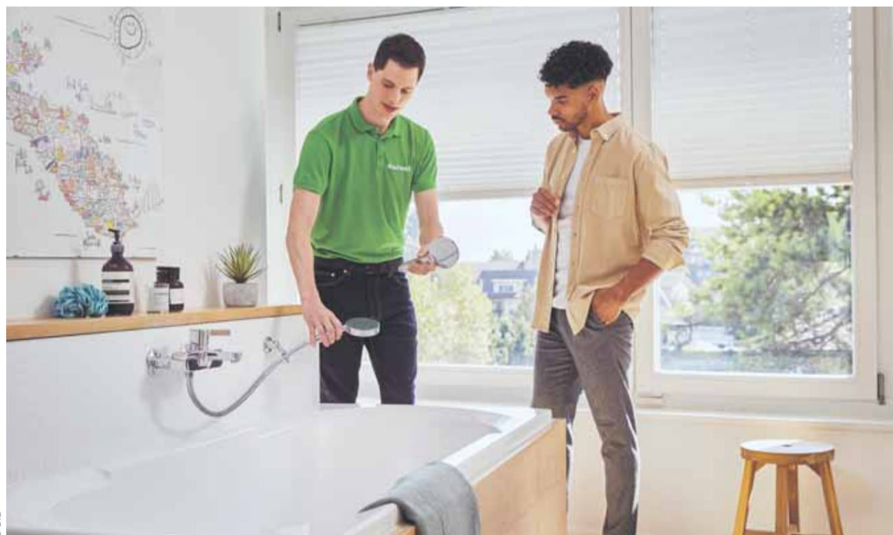
Les douches «éco» permettent d'économiser 45% d'énergie. Les SiL proposeront à nouveau cette action de douches à CHF 10.- du 1 er juin au 30 septembre 2021. Coupon de commande dans le prochain numéro.

Nous utilisons en moyenne, 45 litres d'eau par jour et par personne aux toilettes. Certains besoins ne nécessitent pas une grande