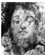
Surimpression, années 1940