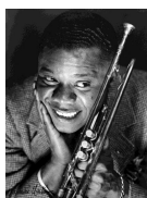
Louis Armstrong, 1934