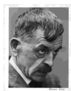
Charles Ferdinand Ramuz, 1934