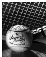
Etude, balle de tennis, années 1930