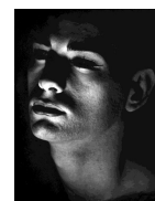
Inconnu, années 1950