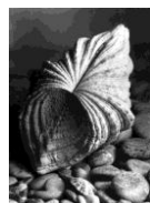
Etude coquillages, années 1930