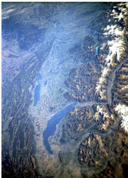
Vue de la navette Endeavour , 10 octobre 1994