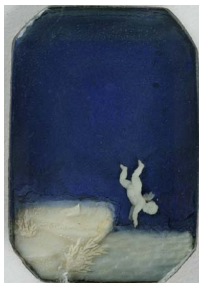
Alexandre Perregaux La chute de l'ange, miniature sur ivoire 2.7 x 1.8 cm, vers 1800