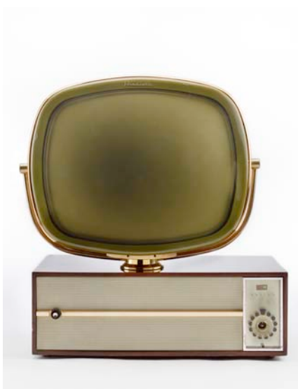
Télévision à écran pivotant «Philco predicta», 1958-1960

Le défi qui se présente au responsable du musée d'histoire est donc de percevoir ce qui sera pertinent et signifiant à l'avenir. Nul ne peut pourtant savoir ce que sera le choix des générations futures et quelles seront leurs icônes de notre présent.