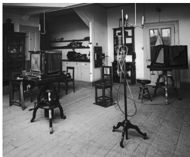
Rodolphe-Archibald Reiss Laboratoire de prise de vue, Institut de police scientifique, Lausanne Détail, vers 1914

Au sein d'un dispositif illustrant l'évolution des méthodes policières pour l'identification des criminels (du fer à marquer à la séquence ADN), l'exposition présente une série de fiches du 19 e siècle. Très succinctes, elles sont cependant dès les années 1850 enrichies d'une photographie. Mais les informations qu'elles contiennent restent dérisoires pour un travail de repérage et d'identification efficace: descriptions approximatives, prises de vues sans systématique, classement empirique, etc. Des progrès majeurs sont réalisés lorsqu'en 1896 la méthode d'Alphonse Bertillon est introduite en Suisse. Elaborée dès 1882, elle inclut la mesure rigoureuse de certaines parties du corps (le signalement anthropométrique) et un procédé de classement méthodique permettant de retrouver toute personne recensée. Chaque fiche est dotée d'un portrait photographique de face et de profil à l'échelle 1/7 e , auquel s'ajoutera, dès 1902, un relevé des empreintes digitales. Les appareils et le mobilier spécial, telle la «chaise de pose», favorisaient le respect d'un strict protocole dans la prise de vue et l'élaboration du document.